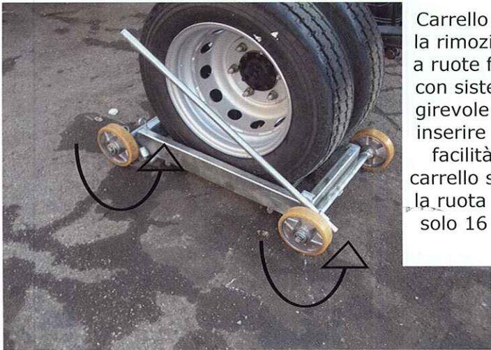
Carrello per la rimozione a ruote fisse con sistema girevole per inserire con facilità il carrello sotto la ruota alto solo 16 cm