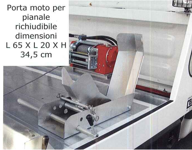
Porta moto per pianale richiudibile dimensioni L 65 X L 20 X H 34,5 cm